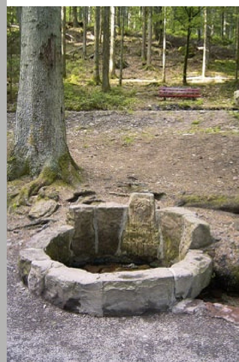
Die Kinzigquelle im Zauberland Lossburg

Sammeltopf zahlreicher Zuflüsse im Quellgebiet des Lossburger Zauberlandes war und ist die Kinzig. 1904 erhielt die Quelle mit der stärksten Schüttung in einem gefassten Rund ihren symbolischen Namen: Kinzig-Ursprung. Nach 93 Kilometern mündet sie bei Kehl in den Rhein. Sie sorgte entlang dieser Strecke – bis heute – für die Lebens-Garantie und -Qualität der Kinzigtäler.