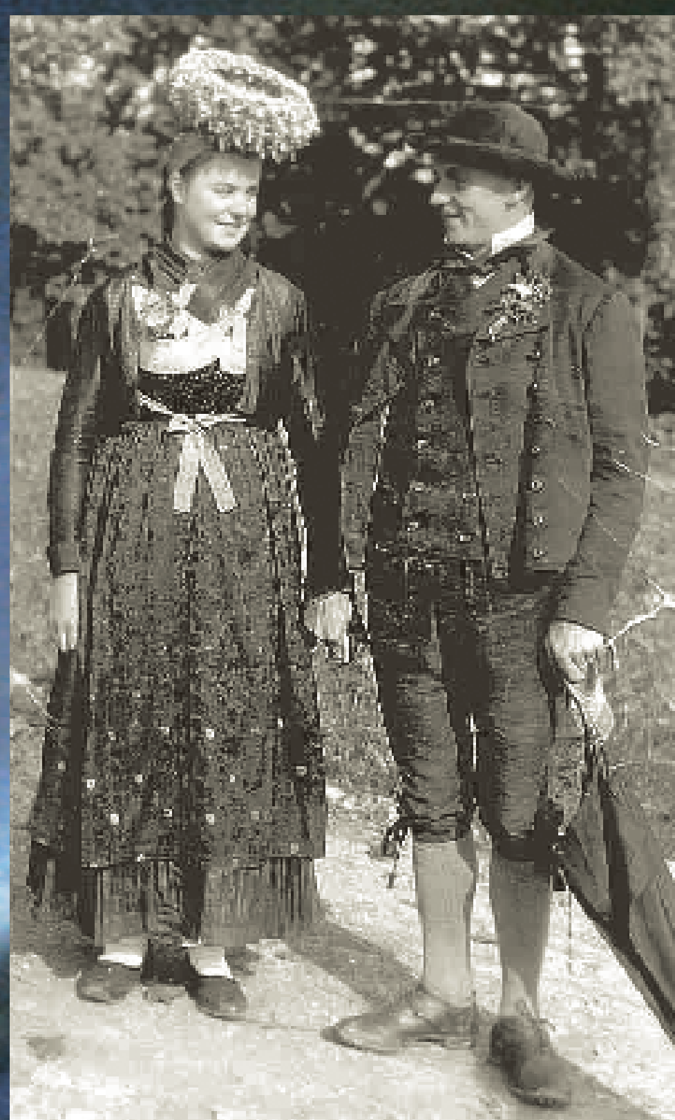
Ein Lossburger Brautpaar mit der typischen Lossburger Bräutkrone, dem Schappel (Trachtengruppe Lossburg 1908 e.V.).

Entschuldigt, ich red zu viel. Das macht der Wein, den's auf der Hochzeit gab. Aber sei's drum, den Weg kann man nicht verfehlen, der führt immer die Kinzig entlang. So ein kleiner Bach ist sie hier! Mehr Wasser ist aus den Quellen bei Lossburg nach dem Abzweig des Mühlgrabens nicht übrig. Und doch ist die Kinzig keine halbe Stunde weiter schon ein flößbarer Bach.«